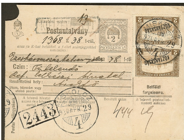
Periode 1 Postwissel van 1368 K 38, tarief 14 x 40 fi = 5 K 60.